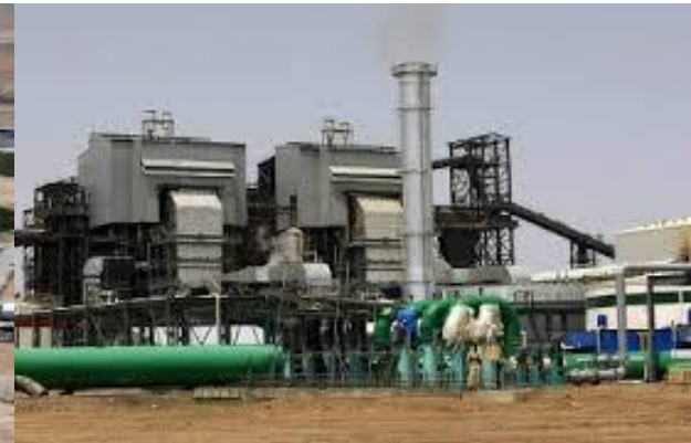
Kenana sugar company- Sudan