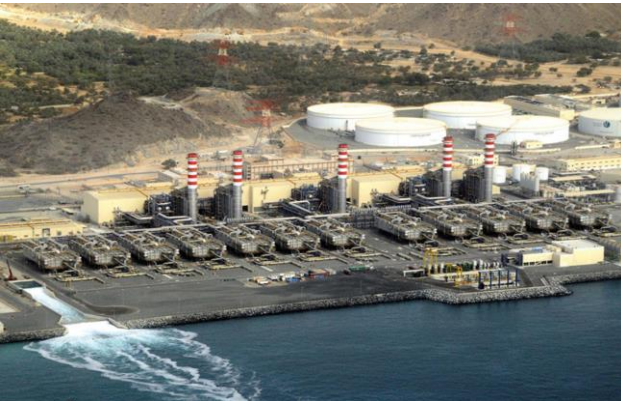
Fujairah desalination plant - UAE