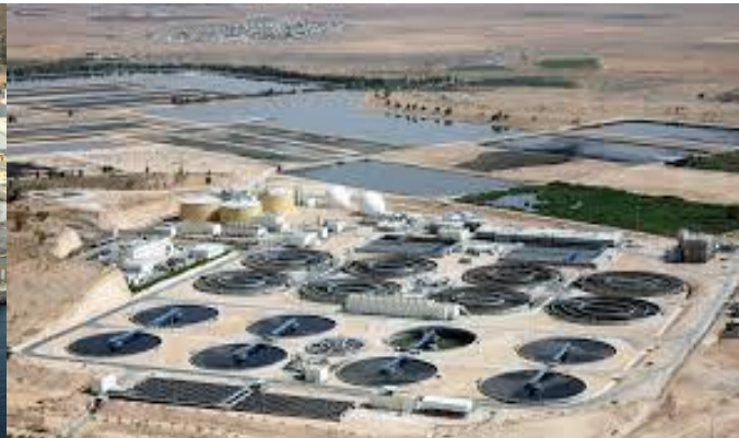
Kherbet El-Samra WWTP - Jordan