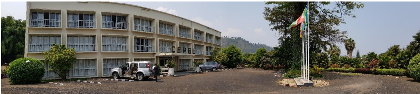
Bureau ABAKIR au bâtiment CEPGL (Communauté Economique des Pays des Grands Lacs) à Rubavu, Rwanda