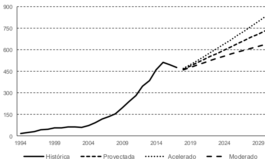
Gráfico 2 Evolución y proyecciones de agroexportaciones en el valle de Ica (En millones de dólares)