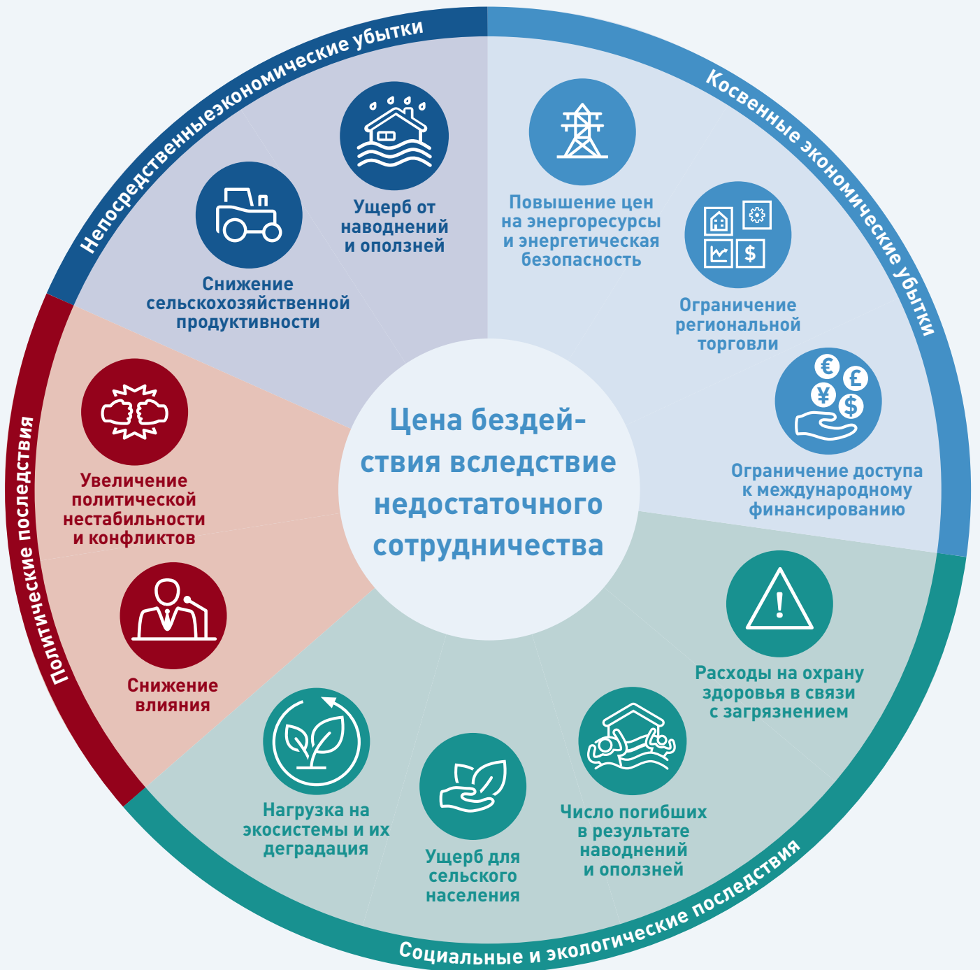
Инфографика 1. Категории ущерба, обусловленного недостаточным сотрудничеством